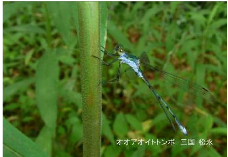
オオアオイトトンボ 三国・松永

第399回例会 7/16（月・祭日） 雨天中止 水辺の自然観察会と魚タッチング教室 くるめウス横の高良川の浅瀬で水質と植物と魚類の観察教室を行います。事前に申し込みをお願いします。 集合：くるめウス 時間：10:00～12:30 参加費：無料 定員20名 持ち物：着替え、帽子、お茶、筆記用具 問合せ：0942-46-8622（古賀）