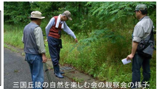
三国丘陵の自然を楽しむ会の観察会の様子

参加費：大人のみ200円（保険料込） 8月の観察会はお休みです。 ブログは 三国丘陵 検索 で すぐにヒットします。