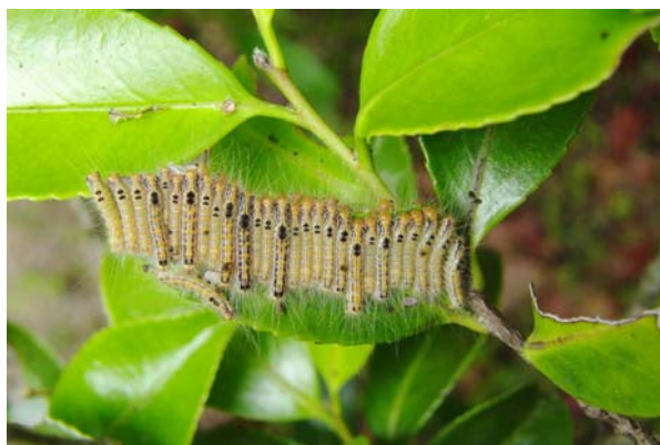
植え込みのサザンカの葉、気をつけましょう