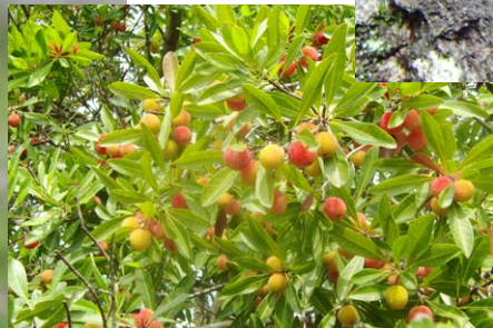
ヤマモモの実、この木の実は大きい。